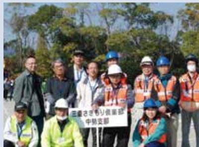
修了生の活動例 防災訓練での啓発活動