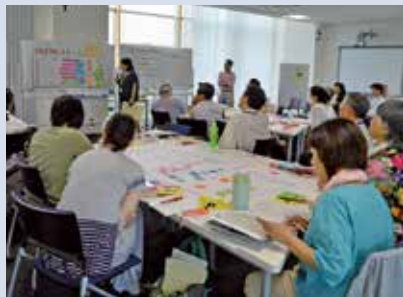
講義・演習の風景（ファシリテーション演習）

みえ防災・減災センターでは、みえ防災コーディネーターやみえ防災塾修了生に登録いただく「みえ防災人材バンク」を設け、防災人材の情報を集約し、市町・企業・地域等からの要請に応じて適切な人材を紹介することで、防災人材の活用を促進しています。