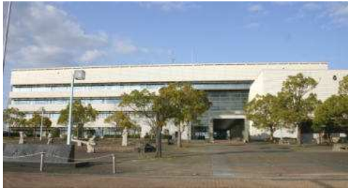
名張市役所 1階大会議室